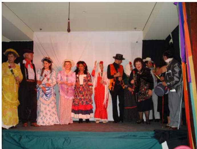
El elenco de Zarzuela 2006 al finalizar su presentación en el Club Español de Sydney.

La directiva del Club Español quiere felicitar y hacer público