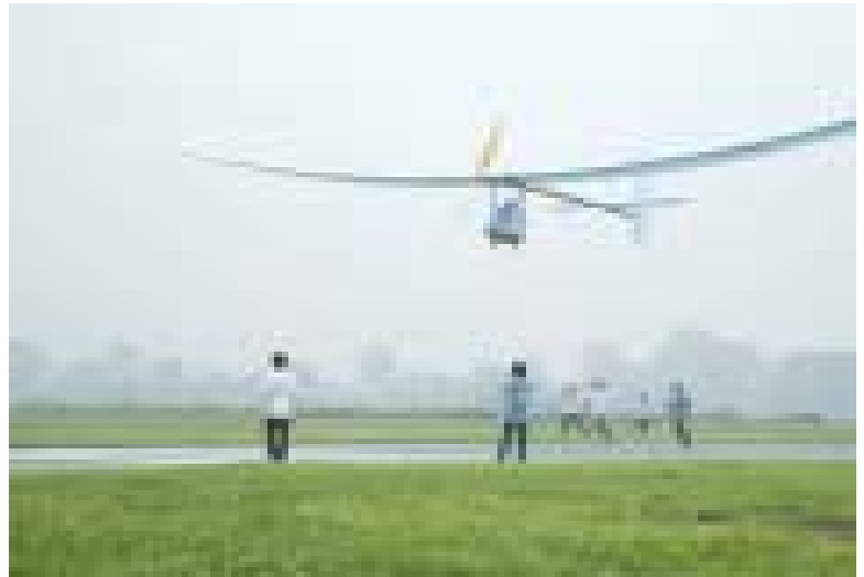
El avión voló 132 metros más que el de los hermanos Wilbur y Orville Wright en 1903, aunque tardó exactamente lo mismo. ●

El 16 de julio, en el aeropuerto de Okegawa y frente a oficiales de la Asociación Aeronáutica de Japón (JAA), el aparato voló la distancia indicada impulsado por 160 pilas AA. La JAA buscará el reconocimiento de la Federación Aeronáutica Internacional, como el primer vuelo impulsado por este tipo de pilas.