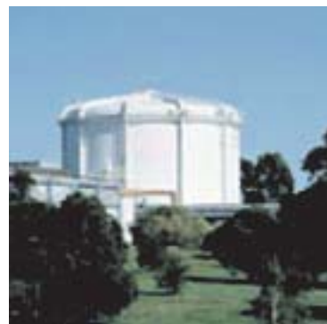
Reactor de Lucas Heights

No menos importante es encontrar un método de librarse de