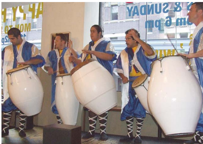
El Candombe oriental dio un brillo singular a la fiesta.