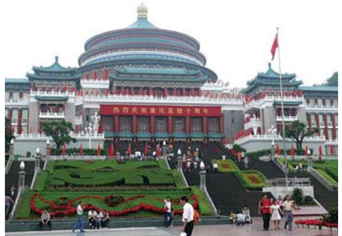
A la ciudad de Chongqing se llega remontando el río Yangtzé.

Viajamos luego a Wuhan y de esta ciudad salimos por