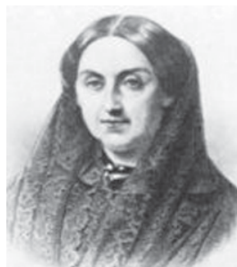
Cecilia Böhl (a) Fernán Caballero