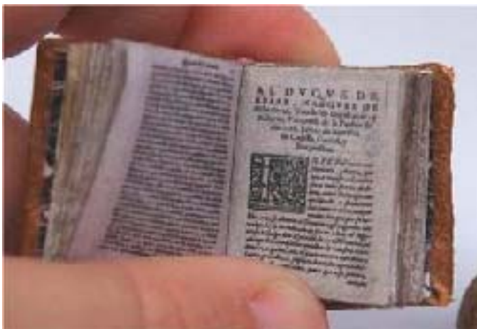
La página muestra la dedicatoria de Cervantes a don Alonso Diego López de Zúñiga Sotomayor, Duque de Bejar, que precede al prólogo del autor.

Hay quien puede pensar que su labor se limita a “escanear” los ejemplares de formato convencional a un tamaño determinado, imprimirlos, cortarlos y encuadernarlos con cierta gracia... Se equivocan. Sus trabajos van más allá de una simple reducción: son una reproducción absolutamente fiel de los originales, pero en miniatura. Lo que la lleva a “minimizar” proporcionalmente no sólo