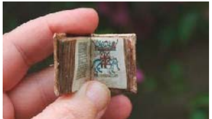
Uno de los más pequeños libros de la colección, título no identificado aunque se trata de un códice que la foto denomina “bestiario medieval”.

el tamaño de las páginas y las ilustraciones sino también el grosor del papel (“el gramaje”); coser a mano los pliegos con un bastidor diminuto; envejecer cada una de las páginas con la pátina precisa para que se parezca lo más posible al modelo; encuadernarlos en