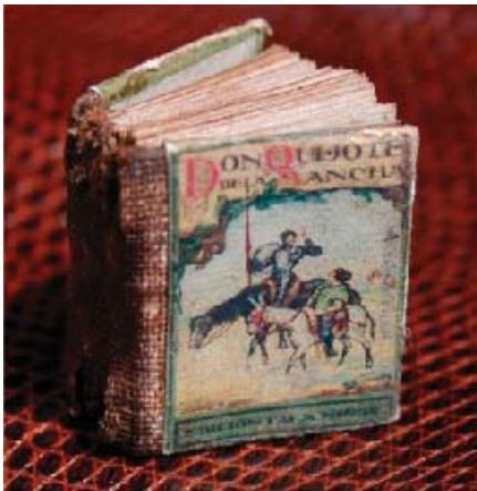
Un ejemplar de la obra magna de Miguel de Cervantes en miniatura, verdadero “camafeo” literario.