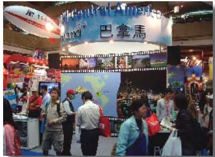
Parte del pabellón centroamericano de la Feria Internacional de Turismo de Taipei, que cada día atrajo unos 250.000 visitantes.

Tiembla la pequeña isla. Hace unas noches observaba desde mi octavo piso a más de 100 personas que salieron disparadas de sus viviendas debido a un sismo larguito y bailarín. La política le hace el unísono y a mí la inquietud me sigue repercutiendo en lo que queda de la sesera. Costa Rica —para dar un ejemplo—, se retiró como aliado de Taiwán hace un par de años y ahora disfruta del apoyo total de China, ¿cuál le va a seguir? ¿O será decisión del mismo Taiwán? ●