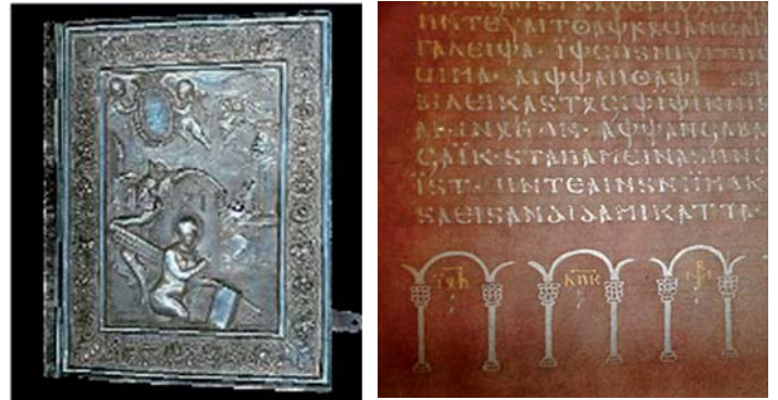
Cubierta del Códice (izq.) y un fragmento de su primera página.

mada Guerra de los Treinta Años (1618-1648), que enfrentó principalmente a Francia con los Habsburgo y en la que intervino la por entonces potencia Suecia, en 1630 y hasta 1635. Los temibles ejércitos suecos llegaron hasta Praga y la ocuparon, dato interesante si se tiene en cuenta que, casual y curiosamente, la Biblia de Plata terminó desde entonces alojada en la biblioteca de la reina Cristina de Suecia. Pero las peripecias no terminan ahí. Resulta que esta señora, pertinaz discípula de Descartes, se hizo católica y abdicó, y desde entonces no se supo qué sucedió con el Codex Argenteus hasta que el librero de los países bajos Isaac Vossius se lo vendió al canciller sueco Magnus Gabriel de la Gardie. Se supone que el lomo del libro tenía originalmente perlas y gemas, pero durante su vida herética algún benefactor de la humanidad consideró que era mejor que la Biblia de Plata luciera más sobria, por lo que la despojó de aquellos inútiles adornos. De la Gardie hizo encuadernar los folios tal como están hoy en día y tuvo la generosidad y buen tino de donar el Códice Argénteo a la Universidad de Uppsala. Hasta ahí, todo bien, pero resulta que en 1995 fue robado de una exposición, solo para aparecer un mes más tarde en uno de los depósitos de consignas de la estación central de trenes de Estocolmo.