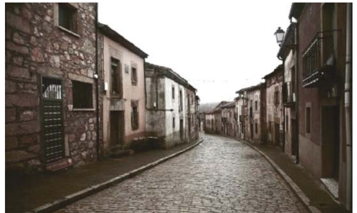
Ghost town? Retortillo de Soria.

La Voz de Galicia , publicó un artículo con el sugerente título “Aldeas a precio de un pisito”, caseríos puestos a la venta en los