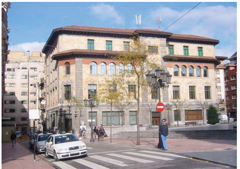
El castillo de Alfonso III en Oviedo

Acaso una de las mejores noticias que nos da Oviedo, la capital del principado, es que el consulado peruano es honorario. Vale decir que no le cuesta un dólar al Perú contar con este dinámico centro de relaciones. Miles de actuaciones consulares que antes debían de realizarse en Madrid o Barcelona se hacen allí y están a